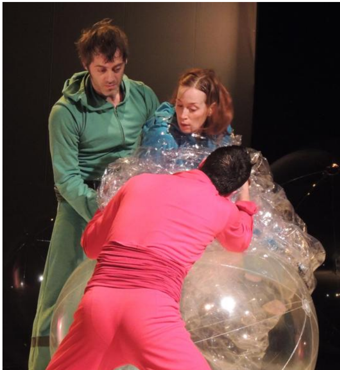
Miravella : une chrysalide s'ouvre à la vie.

CENTRE EUROPE Festival jeune public Momix Rêve universel